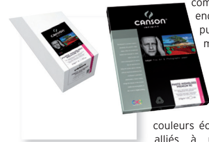
Photo HighGloss Premium RC a été développé en conformité avec la norme de conservation ISO 9706 pour répondre aux exigences les plus fortes en terme de résistance au vieillissement. Photo HighGloss Premium RC offre une excellente Dmax et un vaste espace colorimétrique, le rendant incontournable pour le tirage de photos couleur haut de gamme.

Photo HighGloss Premium RC est un papier ultra lisse, sans acide, composé de fibres alpha celluloses, enduit avec du polyéthylène puis une succession de couches microporeuses pour recevoir les encres. Ce support ultra blanc offre le niveau de brillance le plus élevé du marché des papiers photo RC. Il permet ainsi de reproduire des couleurs éclatantes et des noirs profonds alliés à une résolution performante, pouvant atteindre jusqu'à 5760 dpi.