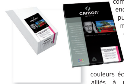
Photo HighGloss Premium RC a été développé en conformité avec la norme de conservation ISO 9706 pour répondre aux exigences les plus fortes en terme de résistance au vieillissement. Photo HighGloss Premium RC offre une excellente Dmax et un vaste espace colorimétrique, le rendant incontournable pour le tirage de photos couleur haut de gamme.

Photo HighGloss Premium RC est un papier ultra lisse, sans acide, composé de fibres alpha celluloses, enduit avec du polyéthylène puis une succession de couches microporeuses pour recevoir les encres. Ce support ultra blanc offre le niveau de brillance le plus élevé du marché des papiers photo RC. Il permet ainsi de reproduire des couleurs éclatantes et des noirs profonds alliés à une résolution performante, pouvant atteindre jusqu'à 5760 dpi.